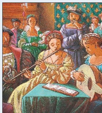
La cour de François 1 er